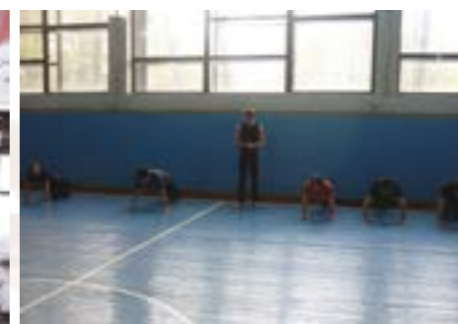
TRANSMISSION DE SAVOIR Stage de Diction avec les étudiants diplomates en français de l'université BGU de Minsk animé par les Masteriens.