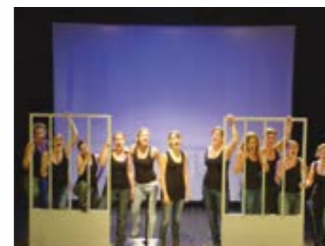
Animation de conte à la bibliothèque française de Minsk.