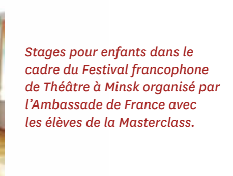
Stages pour enfants dans le cadre du Festival francophone de Théâtre à Minsk organisé par l'Ambassade de France avec les élèves de la Masterclass.