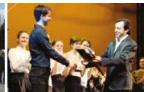
(EN 2012 : VOYAGE À MOSCOU ET PARTICIPATION DU GROUPE AU FESTIVAL DE CHANSON THÉÂTRALE DE PERM).